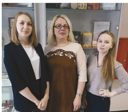
Команды КГБПОУ «ББМК». Б – «AlbusHalate».