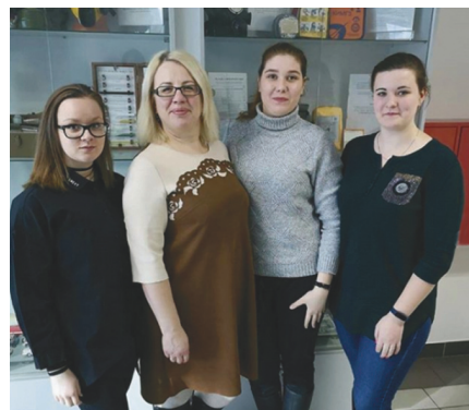
А – «120/80».