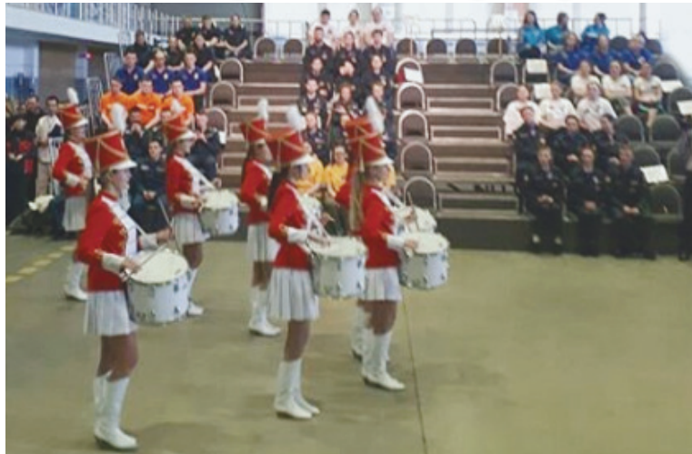
Торжественная церемония открытия соревнований.