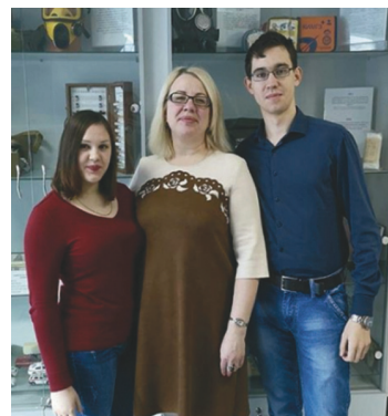
В – «Неуловимые спасатели».

страдавшим при острых стрессовых состояниях.