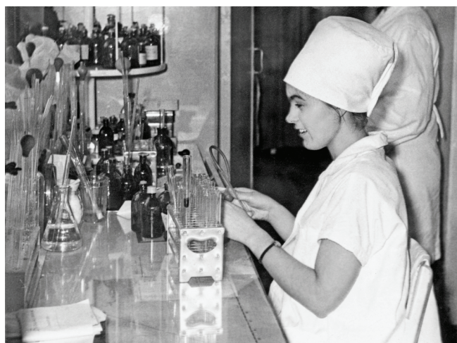
1970 год. Клиническая лаборатория.

влены различные реорганизации и преобразования, поликлиника оснащена современным лечебно-диагностическим оборудованием, постоянно внедряются информационные, стационарозамещающие и другие инновационные технологии, национальные проекты «Открытая регистратура», «Бережливая поликлиника», началась подготовка к